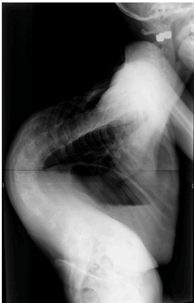
Figura 5 – Radiografia da coluna realizada em carga, incidência de perfil, da doente 3, de Setembro de 2009, nas quais é notória cifoescoliose muito acentuada.

Actualmente com 15 anos, frequenta irregularmente o