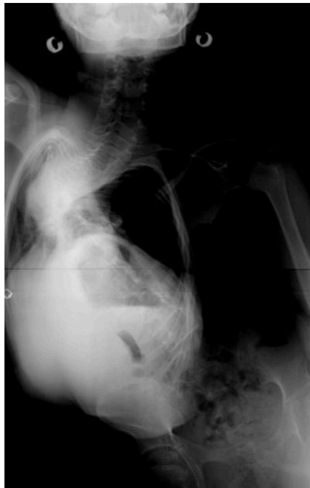
Figura 6 – Radiografia da coluna realizada em carga, incidência de frente, da doente 3, de Setembro de 2009, nas quais é notória cifoescoliose muito acentuada.