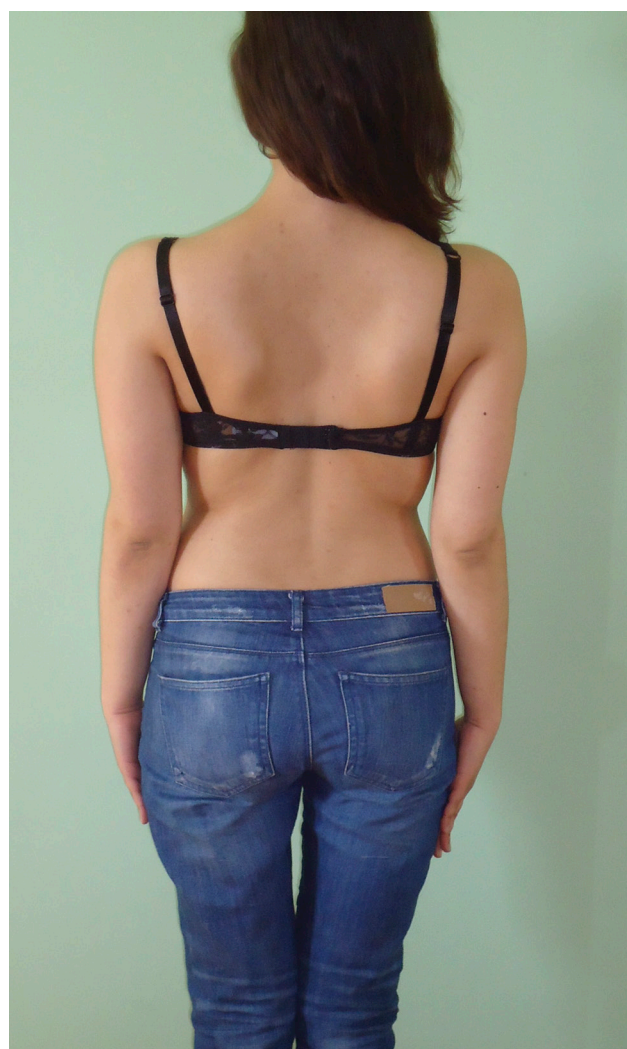
Figura 4 – Doente 2, vista posterior.