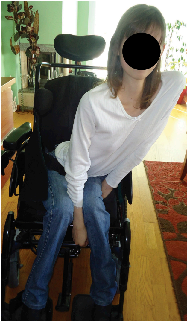
Figura 1 – Doente 1 em cadeira de rodas. Note-se a atrofia muscular e magreza acentuadas.

Apresentava aos 11 anos um fenótipo semelhante ao da irmã, com fraqueza e atrofia muscular das cinturas e região cervical, ausência de reflexos osteotendinosos, sinal de Gowers positivo, hipertrofia dos gêmeos, incapacidade