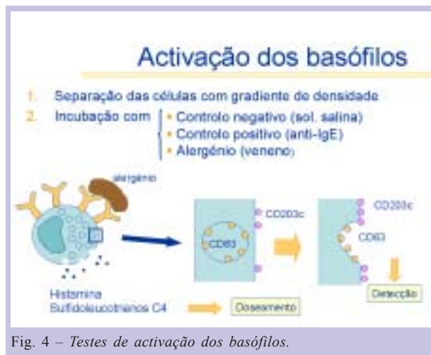
Fig. 4 – Testes de activação dos basófilos.

ponte entre duas moléculas de IgE na superfície dos basófilos. Contudo, o consumo de tempo e o custo destes ensaios em dois tempos (a) incubação celular e (b) quantificação de mediadores, tem limitado a sua aplicação 4 (figura 4).