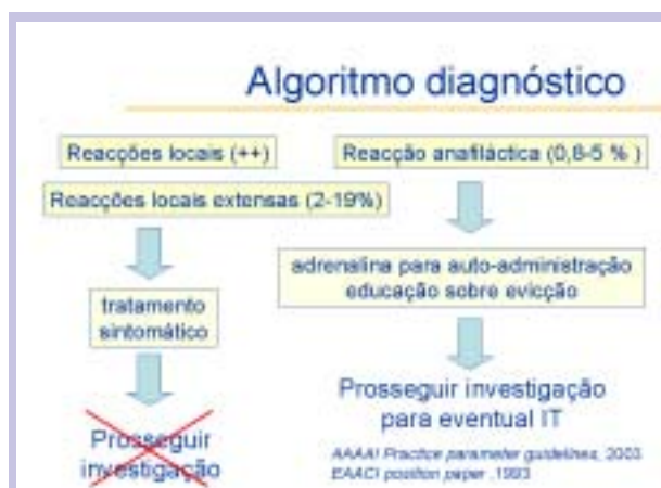
Fig. 1 – Algoritmo diagnóstico da alergia a veneno de himenópteros segundo as guidelines das Academias Europeia e Americana de Alergologia.

O algoritmo diagnóstico da alergia a veneno de himenópteros inclui a história de anafilaxia, e a demonstração da existência de IgE específica ao veneno do insecto agressor por testes cutâneos ou doseamento sérico (figura 1).