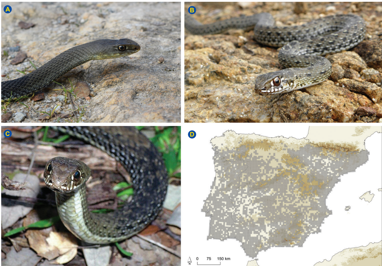
Figura 4 – (A) e (B) Malpolon monspessulanus no distrito de Évora, cortesia de Luís Guilherme Sousa. (C) Malpolon monspessulanus no distrito de Évora, cortesia de Marco Caetano. (D) Distribuição de Malpolon monspessulanus na Península Ibérica – construção a partir dos dados UTM 10x10 km disponíveis em Loureiro et al. (2008) e SIARE (2020).

O membro afetado deve ser mantido em posição confortável, mas não excessivamente elevado. 15 A manipulação excessiva da extremidade afetada deve ser evitada até que a avaliação seja concluída ou até que o SAO seja