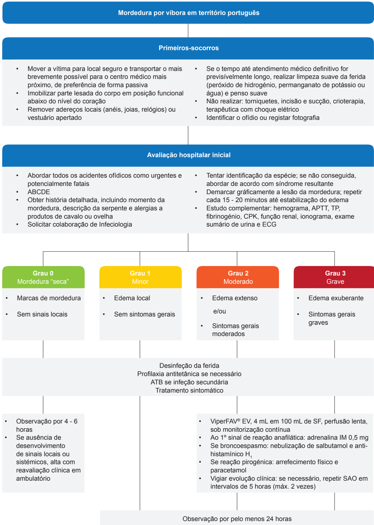
Figura 3 – Abordagem clínica de mordedura por víbora em território português

ABCDE: Airway, Breathing, Circulation, Disability, Exposure; APTT: tempo de tromboplastina parcial ativada; ATB: antibiótico; CPK: creatina fosfoquinase; ECG: eletrocardiograma; IM: intramuscular; TP: tempo de protrombina; SAO: soro antiofídico.