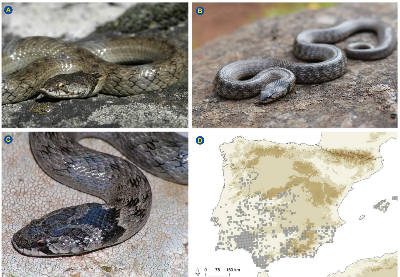
Figura 5 – (A) e (B) Macroprotodon brevis no distrito de Évora. (C) Macroprotodon brevis no distrito de Évora. (D) Distribuição de Macroprotodon brevis na Península Ibérica – construção a partir dos dados UTM 10 x 10 km disponíveis em Loureiro et al. (2008) e SIARE (2020).

Não existe tratamento específico. 14 Institui-se tratamento de suporte, incluindo analgesia, profilaxia antitetânica e antibioterapia na presença de infeção secundária.