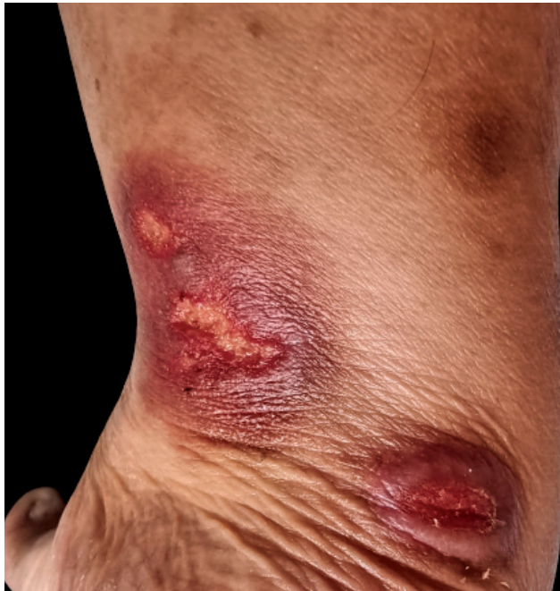
Figura 1 – Úlceras cutâneas bem delimitadas, com bordo eritematoso e cerca de 1 a 3 cm, localizadas no tornozelo

Palavras-chave: Metotrexato/efeitos adversos; Úlcera Cutânea/induzida quimicamente Keywords: Methotrexate/adverse effects; Skin Ulcer/chemically induced