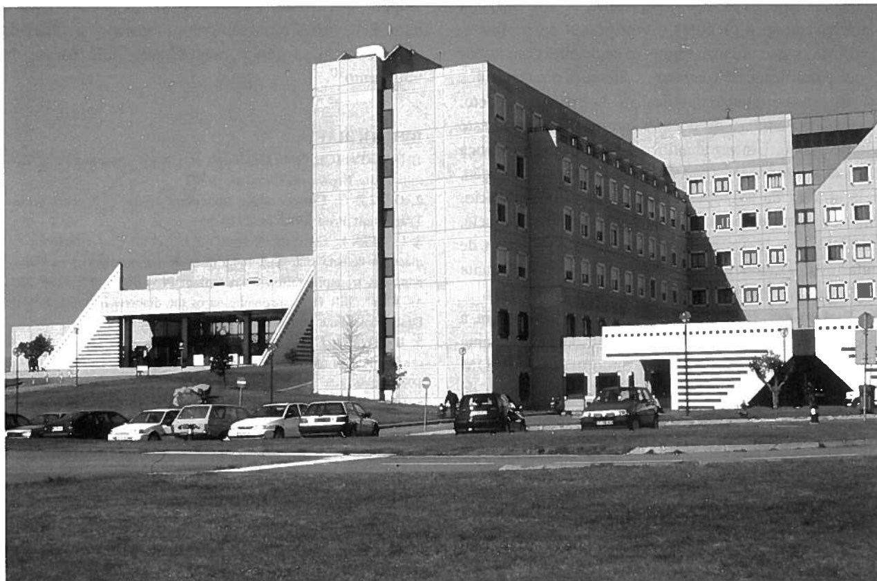
Hospitais da Universidade de Coimbra