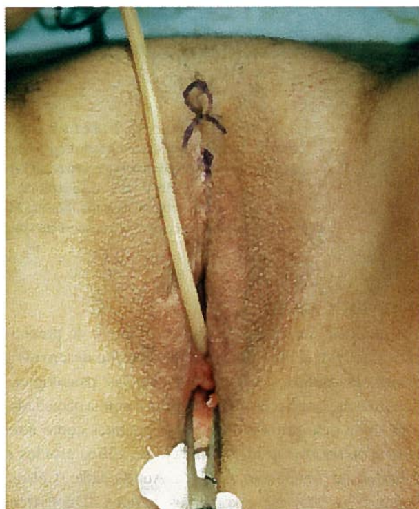
Fig. 2a- Pré-operatório