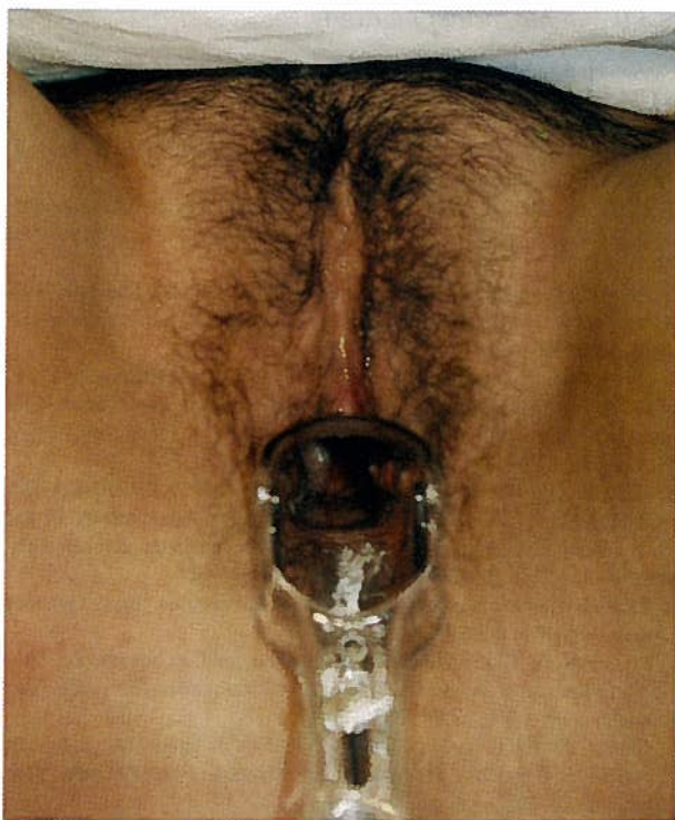
Fig. 3- Resultado aos 6 meses

seguintes serão efectuados com a colaboração da doente no intuito de a instruir nos cuidados de assepsia diários (desinfecção e colocação do molde) que se prolongam por cerca de seis meses de forma contínua ou intermitente caso inicie vida sexual activa ( Figura 3 ).