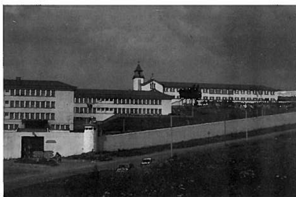
Hospital Prisional S. João de Deus. Caxias.