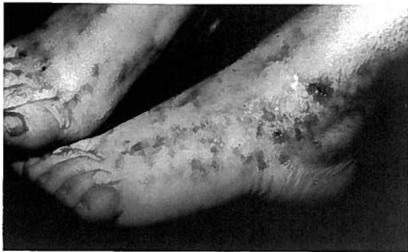
Figura 1: Pigmentação reticulada e estrias atróficas nas regiões maleolares e dorso dos pés.

Observaram deposição de imunoglobulinas e complemento na parede dos vasos da derme superficial, média e profunda cuja hialinização era evidente nos cortes corados pela hematoxilina-eosina e pelo PAS. Eram de IgM os depósitos mais frequentes mas, contrariamente ao que sucedera no trabalho anterior, lograram demonstrar depósitos de IgA, embora em apenas três de dez doentes. Os depósitos de IgA acompanhavam-se sempre de IgG ou IgM, nunca ocorrendo isoladamente. Observaram-se depósitos de fibrina e complemento em todos os doentes estudados e fracções do complemento (Clq, C3, Properdina) em alguns deles. Estes achados levaram os autores a postular um provável mecanismo imunológico para esta afecção. A mesma patogénese foi sugerida por Winkelmann et al., 7 em 1974, numa revisão de trinta e sete casos em que seis se associavam a lupus eritematoso disseminado, periarterite nodosa, artrite reumatóide, síndrome de Sjögren e esclerose sistémica progressiva. Estes autores alargaram o conceito de vasculite livedóide, definindo-a como afecção por imunocomplexos que pode atingir apenas os vasos cutâneos ou afectar igualmente outros territórios, comportando-se como doença sistémica. Este conceito foi perfilhado por Posternak et al. 8 em 1977, a propósito de um novo caso.