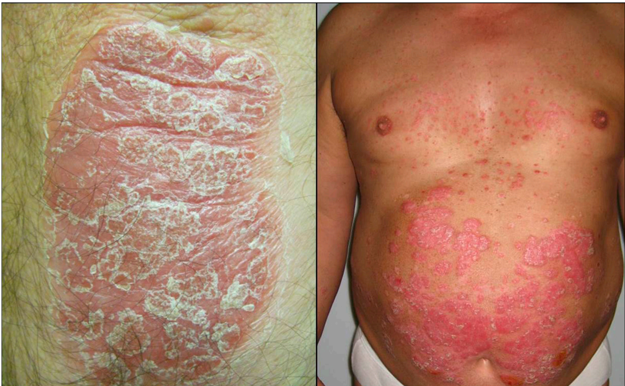
Figura 2 – Lesão característica de psoríase: placa eritematosa, bem delimitada recoberta por descamação branca-prateada; Fenótipo comum a vários doentes com psoríase grave: envolvimento superior a 10% da superfície corporal por placas de psoríase, obesidade central e presença de vários factores de risco cardiovasculares como hipertensão arterial, dislipidemia ou diabetes mellitus.

A presença de prevalência aumentada de HTA em doentes com psoríase comparativamente com outros doentes dermatológicos já foi demonstrada em vários estudos. 4,22-24 Uma recente meta-análise de estudos observacionais demonstrou que os doentes com psoríase apresentam um risco