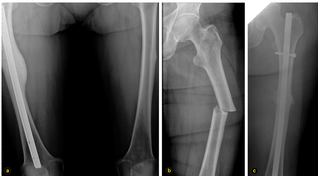
Figura 3 – Radiografias relativas à segunda fratura da doente do caso 2: a) diáfises dos fêmures revelando pós-operatório de osteossíntese endomedular anterógrada à direita e imagem de espessamento da cortical externa esquerda; b) fratura de traço simples e transversal da região diafisária do fêmur esquerdo; c) pós-operatório de osteossíntese endomedular anterógrada do fêmur esquerdo.

modo usual, com recuperação funcional total, tendo retomado terapêutica com alendronato.