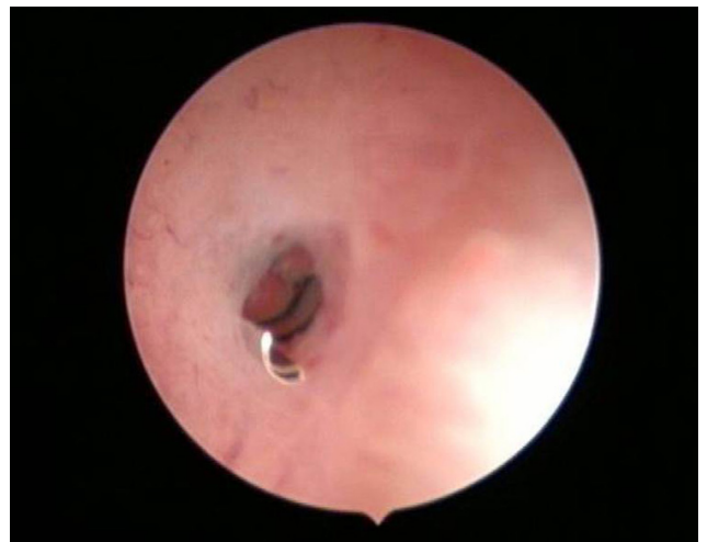
Figura 2 - Visualização do número de espirais visíveis na cavidade após colocação do dispositivo Essure® no ostium tubar da trompa afectada. No caso apresentado, apenas 1 espiral foi deixada visível na cavidade.

O número de espirais visíveis na cavidade uterina, após colocação de Essure®, tem sido apresentado nas melhores séries com um máximo de quatro. 22-25 Na verdade, não existem estudos comparativos, randomizados, analisando os desfechos gestacionais de mulheres com história de colocação de Essure e IVF-ET posterior, em função do número de espirais deixadas visíveis na cavidade uterina após introdução do dispositivo. Os melhores trabalhos publicados 21-25 apresentam limitações importantes relacionadas com o poder amostral e desenhos para investigações multicêntricas serão, seguramente, necessários para esclarecer a segurança dos bons resultados obtidos até à data. Este aspecto reveste-se, na opinião dos autores, da maior importância. A particular preocupação com a ocorrência de