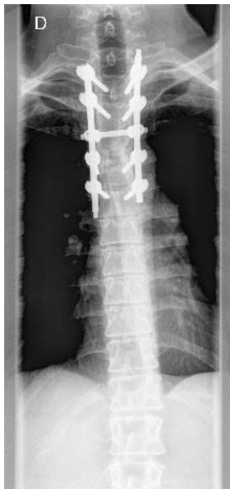
Fig. 1 – Radiografia da coluna dorsal – Instrumentação posterior T2-T3 e T5-T6

Em 06/02/2007 foi transferido para o Serviço de Ortopedia (Unidade Vértebro-Medular) e observado por Medicina Física e de Reabilitação (MFR). Apresentava diplopia e paraplegia ASIA B (de acordo com a American Spinal Injury Association ) com nível sensitivo T4 à esquerda e T8 à direita (com força muscular de todos os músculos-chave dos membros inferiores grau 0); tónus muscular dos membros inferiores diminuído; reflexos