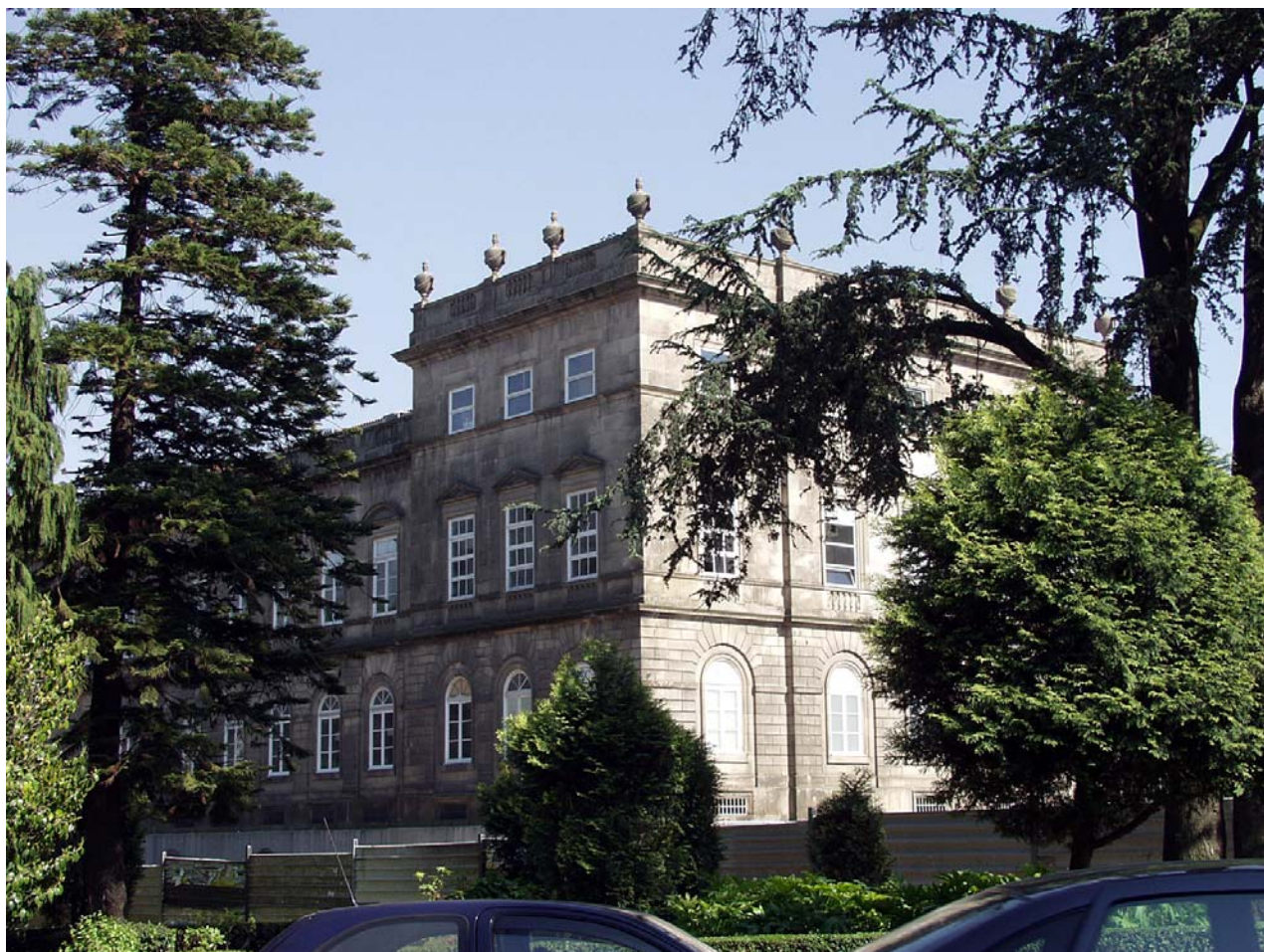
Hospital Santo António. Porto