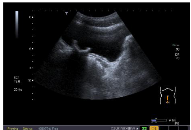
Fig. 3 – Ecografia: Litíase vesical