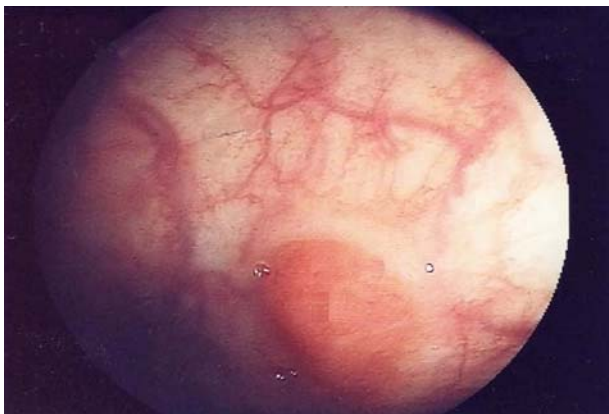
Fig. 1 – Colonoscopia; Volumoso recesso a 12 cm da margem anal no fundo do qual se observa uma lesão plana com 1.5 cm de diâmetro

Mulher de 46 anos de idade, raça branca, casada e residente em Coimbra, assintomática, sem antecedentes pessoais patológicos relevantes, mas com história familiar de carcinoma colorrectal (pai, tio paterno e prima direita paterna, falecidos na sequência de carcinoma do cólon sigmóide e recto respectivamente), tendo sido, por isso, referenciada para colonoscopia em Junho de 2007. O exame revelou um volumoso recesso a 12 cm da margem anal no fundo do qual existia uma lesão plana com 1,5 cm de diâmetro (Figura 1). A análise histopatológica de vários fragmentos da lesão rectal mostrou áreas de mucosa gástrica de tipo fúndico com células parietais e principais, sem displasia epitelial (Figura 2); estes aspectos histomorfológicos revelaram-se compatíveis com heterotopia gástrica no recto. Foi proposto excisão cirúrgica que a doente recusou. Mantém-se assintomática e em vigilância clínica e endoscópica.