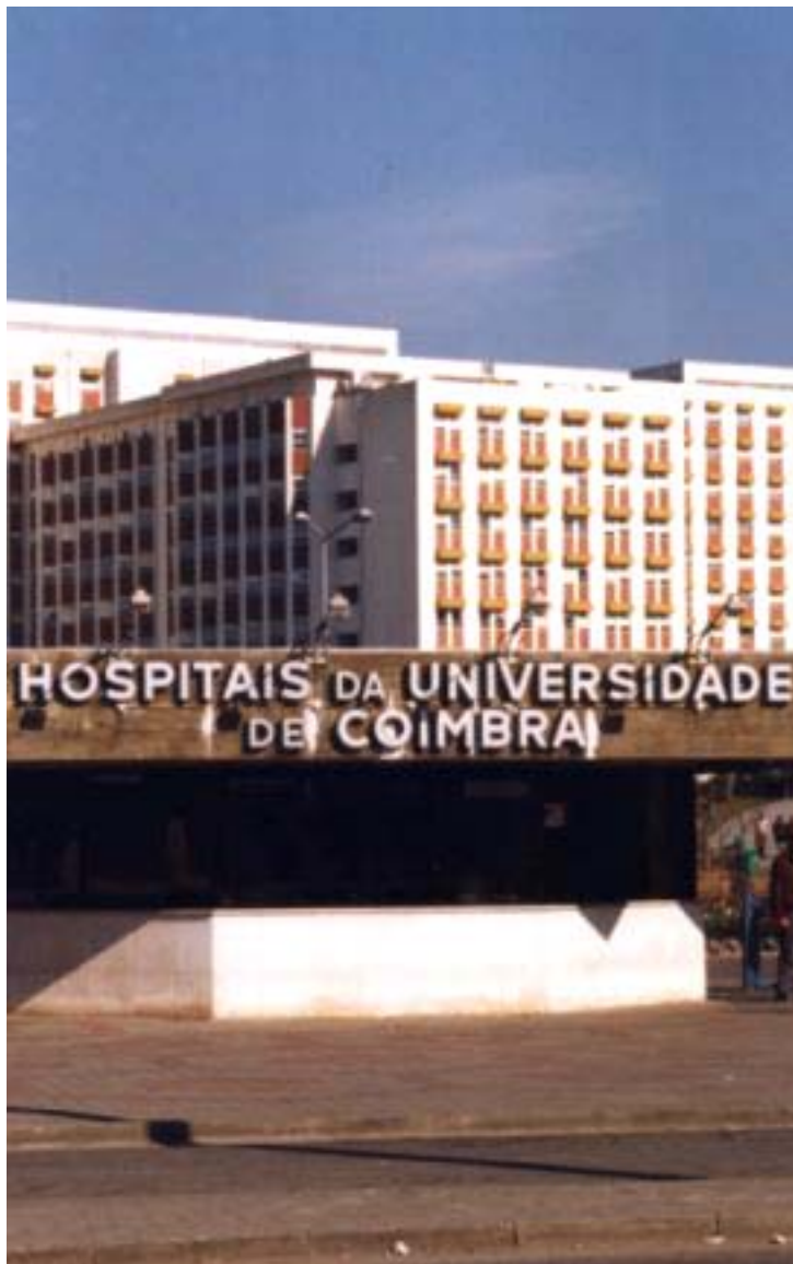
Hospitais da Universidade de Coimbra. Coimbra