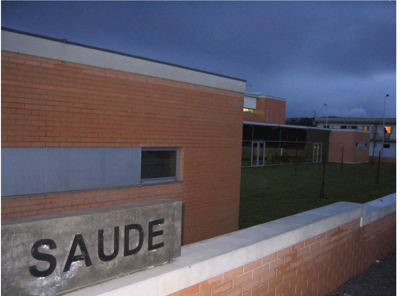
Centro Saúde da Vila Verde. Braga